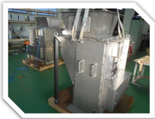
写真2：バイオマス木材チップ等に採 用されているインパクトライン流量計 MODEL No：ILE-30