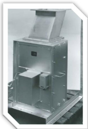
写真4：長年使用されている ILE-61 (スラリーにも使えます)