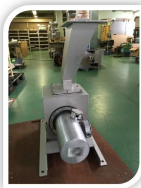
写真3：使用例の多い ILS30-30

写真2：バイオマス木材チップ等に採 用されているインパクトライン流量計 MODEL No：ILE-30